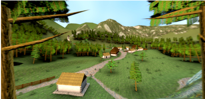
Dedina, v ktorej sa hra odohráva

Trentsinium je hra s pohľadom z tretej osoby, ktorej dej je zasadený do začiatku 14. storočia. Hlavný hrdina sa volá Miroslav. Je to obyčajný dedinčan, ktorý sa stáva strážcom dediny a bojuje proti nepriateľským bojovníkom.